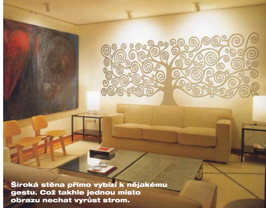
Široká stěna přímo vybízí k nějakému gestu. Což takhle jednou místo obrazu nechat vyrůst strom.