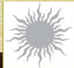
Slunce na stěně, slunce v mysli.